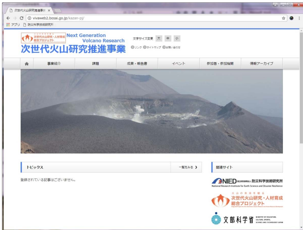
次世代火山研究推進事業専用ホームページ