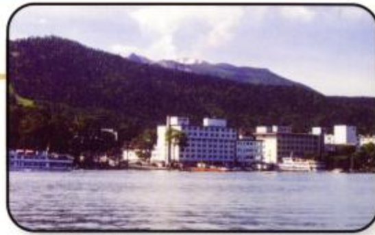
阿寒湖温泉から見た雌阿寒岳 Mt. Me-Akan viewed from Akanko spa.