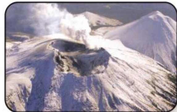
1996年の小噴火 Minor eruption in 1996

阿寒湖の遊覧船から見ると、温泉街の裏手に少しだけ白い煙を上げているのが、雌阿寒岳です。(湖に面してそびえるのは雄阿寒岳です。)