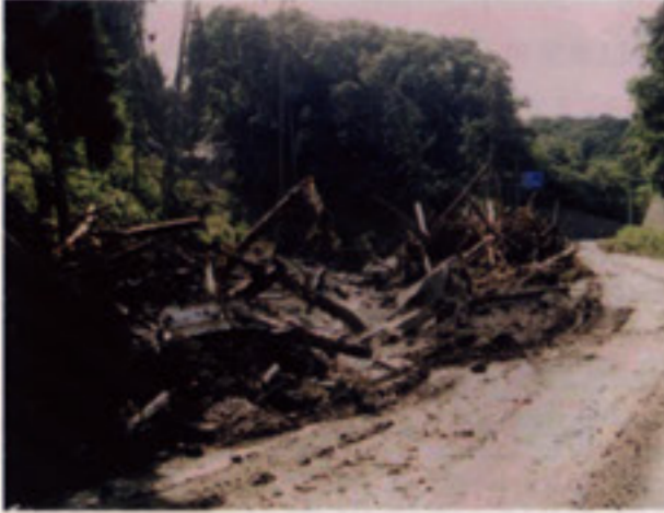
(坪田地区大沢:平成12年7月30日)

泥流とは、大雨のときに泥や石と水が混じりあい、ときには流木などもまきこみながら川や谷底など低い所に沿って流れ下ってくる現象です。