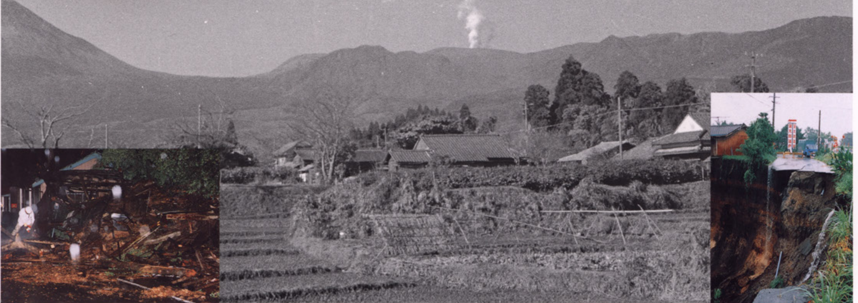
昭和34年 2月17日新燃岳噴火